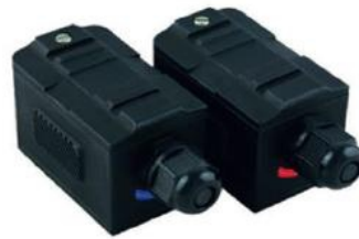
Transdutor para Alta Temperatura (-30 °C a +160 °C)