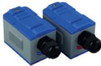
Transdutor Padrão (-30 °C a +90 °C)